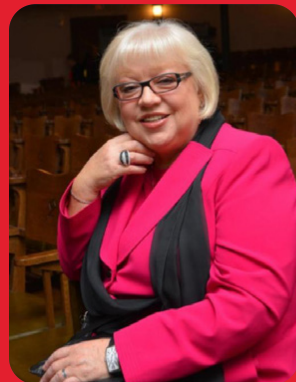
Крючкова Светлана Николаевна

Народная артистка РСФСР, лауреат премии «Ника»